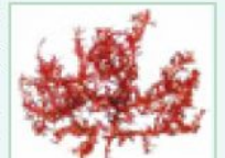
紅色微細藻(イメージ)

海上で強い紫外線を浴びながらも繁殖が可能な海 草、紅色微細藻類から得られる多糖体成分です。化粧 品の成分としても、紫外線からの皮膚保護効果が期待 できることで注目されています。 さらには、即効性のあるシワ改善効果。アルガードがシワ の溝に入り時間とともに収縮。表皮が持ち上げられシワ が伸びる効果があります。