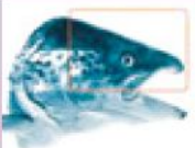
サケ鼻軟骨部位(イメージ)

タンパク質の一種。もともと肌に存在するヒアルロン酸 やコラーゲンとともに細胞外マトリックスを形成する第3 の生体成分です。保水力に優れており、皮膚のハリや 弾力を保つのに重要です。 プロテオグリカンは元々1gが数千万するほどの貴重な 成分。原料メーカーの研究により安価で抽出可能な技 術が近年発見されました。話題の新成分プロテオグリカ ン。お試しください。